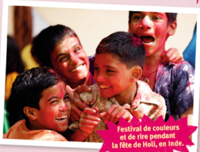
Festival de couleurs et de rire pendant la fête de Holi, en Inde.

Dans ma religion, on peut prier et faire des offrandes aux dieux, au temple ou à la maison. J'aime bien prier avec ma maman!