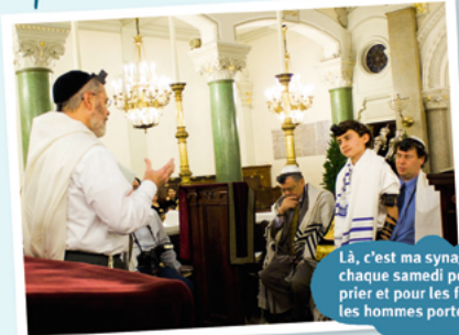
Là, c'est ma synagogue. On y va chaque samedi pour lire la Torah, prier et pour les fêtes! Sur la tête, les hommes portent une kippa.