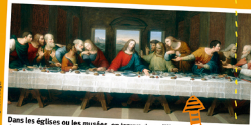
Dans les églises ou les musées, on trouve des milliers de tableaux qui retracent l'histoire de Jésus. Là, c'est son dernier repas avec ses disciples, avant de mourir.

Nous, chrétiens, croyons que Dieu a envoyé son fils Jésus pour partager la vie des hommes. Jésus était un juif qui a vécu et est mort il y a 2 000 ans. Après sa mort, plusieurs disciples ont dit qu'ils l'avaient vu vivant. Ils ont été les premiers chrétiens. Des croyants ont ensuite écrit les Évangiles pour faire connaître la vie et les paroles de Jésus.