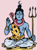
Shiva, le destructeur