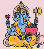
Ganesh, le dieu éléphant