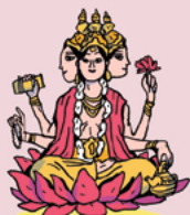
Brahma, le créateur du monde

Dans ma religion, on croit en de nombreux dieux. En voici quelques-uns.