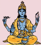
Vishnou, le protecteur