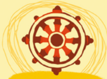
Le dharma représente le cycle de la vie et de la mort.

Le bouddhisme enseigne qu'on peut tous atteindre l'Éveil grâce à la méditation. Méditer, c'est faire des exercices pour ressentir l'immensité du monde et nous détacher de tous les soucis qui nous empêchent d'être heureux.